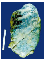
70歳 1日10本 50年